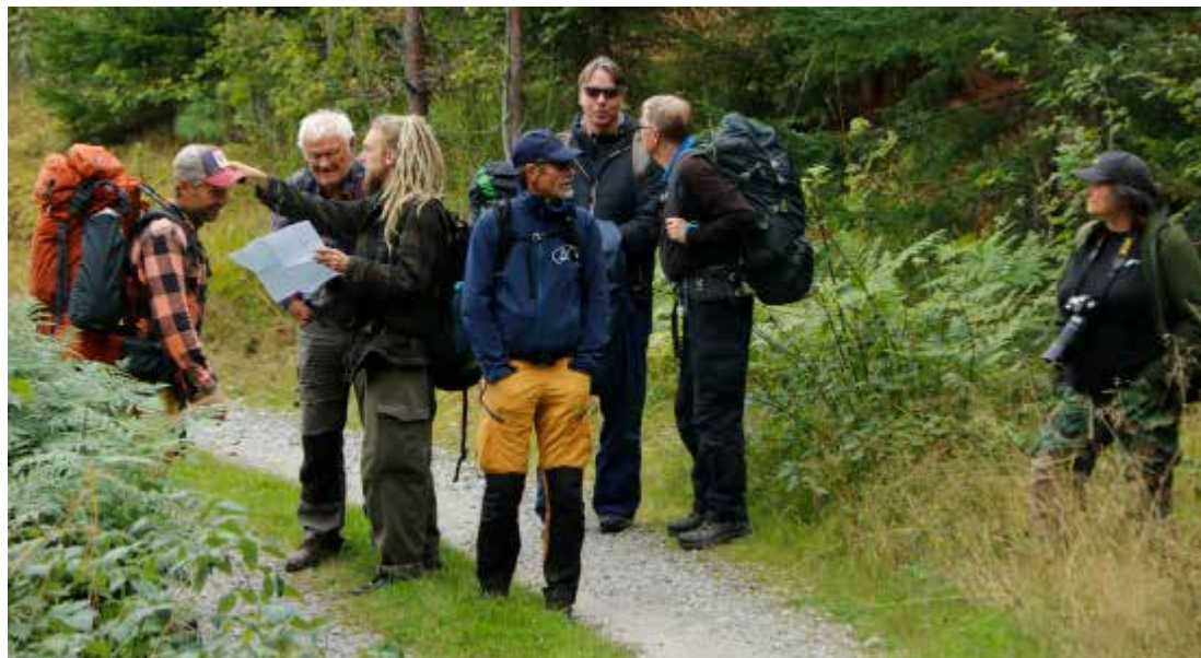
Några ut Stockholmsgruppen på utflykt i Sjunda-reviret.