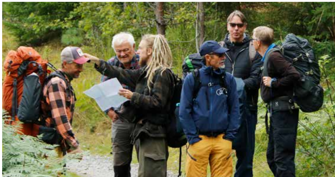
Några ut Stockholmsgruppen på utflykt i Sjunda-reviret.

För medlemmarna har vi varit ute på olika platser i Sjundareviret i sällskap med Andris "Fågelviskaren" både i februari och september. I september var det sex medlemmar som övernattade på en höjd i vargarnas nya "hemområde" sen de lämnat sommarens rendez-vous-plats. Och i november genomfördes ett medlemsmöte med runt 20 medlemmar, där Hans Ring visade bilder på temat "Allt hänger ihop – skogen, bytesdjuren och rovdjuren".